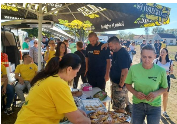
3. Humanitarna off road utrka Žabnica 20.09.2025.