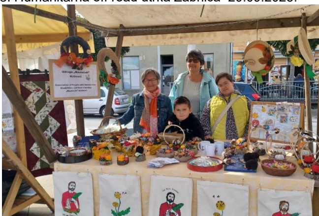
27. Obrtnički i gospodarski sajam