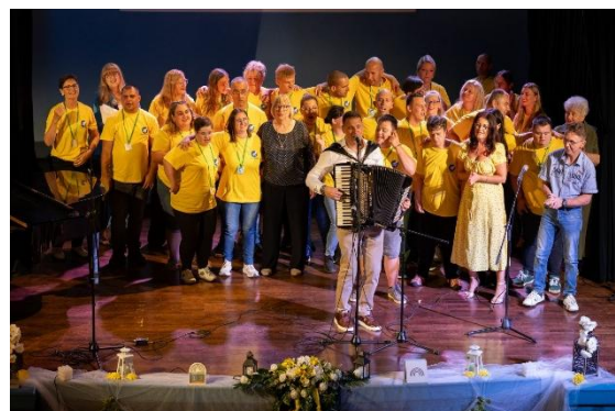
Rođendanski koncert Udruge-13.09.2025.