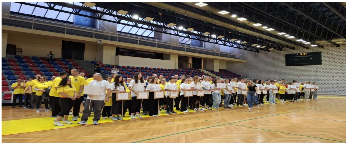
Sportski susret u Splitu 19.05.2025.

Savez je organizirao 14. Sportske susrete udruga osoba s intelektualnim teškoćama u Splitu, 19.05.2025. godine na kojem su se okupili predstavnici Udruga osoba s intelektualnim teškoćama iz cijele Hrvatske.