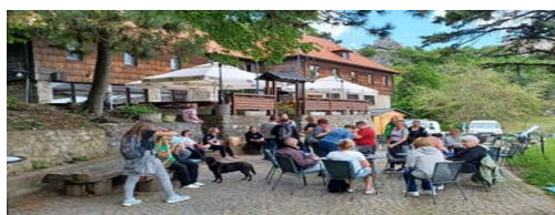
Izlet na Kalnik, 30.04.2025.