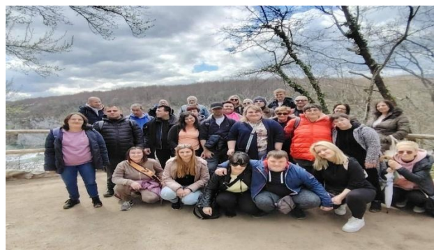
NP Plitvička jezera, 04.04.2025.