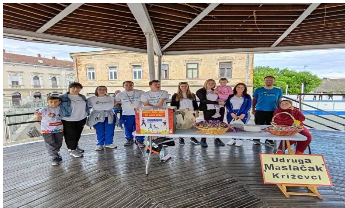
8. Humanitarna utrka "Hodaj, trči, vozi za Maslačak"-24.04.2025.