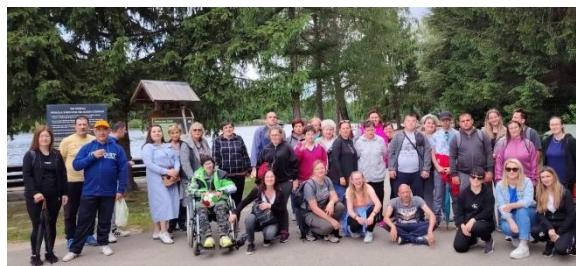
Izlet na jezero Čabraji, 29.05.2025.