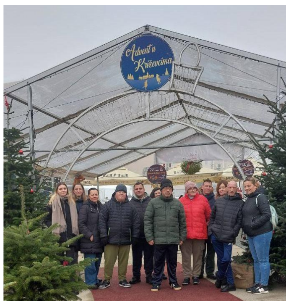
Posjet Adventu u Križevcima