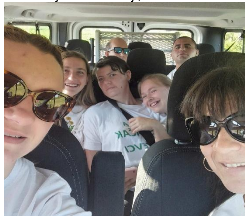
"Ljetni bljesak 2025."