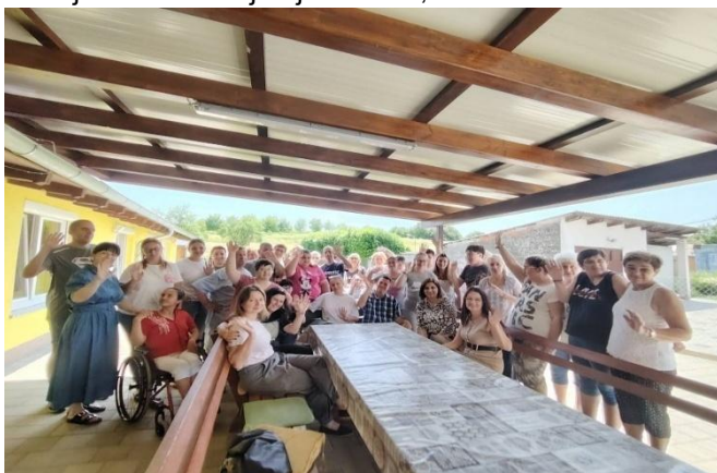
Dani otvorenih vrata 05.-07.06.2025.