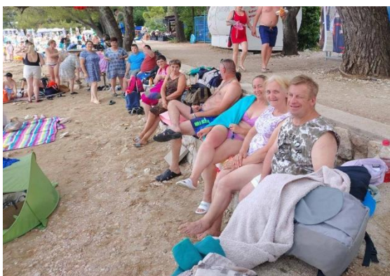
Izlet u Cirkvenicu, 10.07.2025.