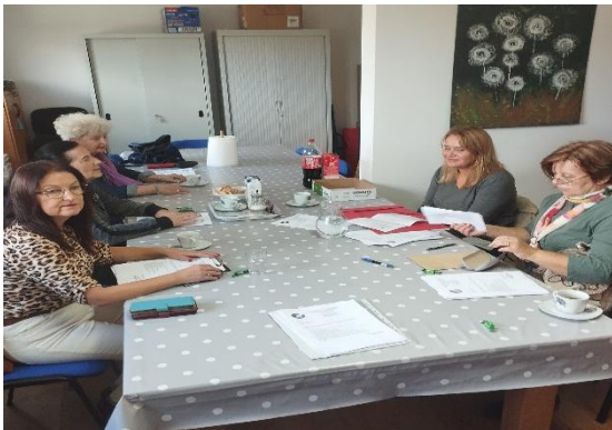
Upravni odbor, 07.10.2025.