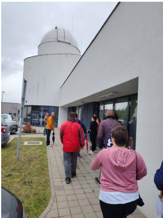
Posjet križevačkoj Zvezdarnici, 09.05.2025.