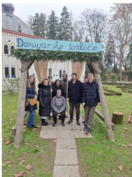
Susret Udruga u Daruvaru, 03.12.2025.