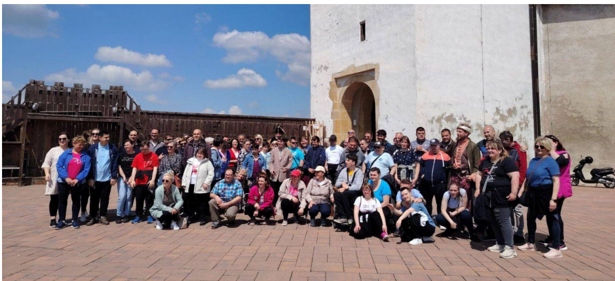
Susret Udruga u Đurđevcu, 28.04.2025.

Sa udrugama na području grada suradnja se očitovala kroz partnerstvo i uključivanje u aktivnosti istih.