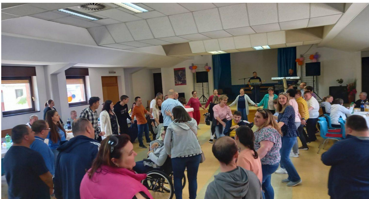
Susret Udruga u Križevcima, 13.05.2025.