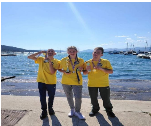
Sportski susret Udruga u Splitu, 19.05.2025.