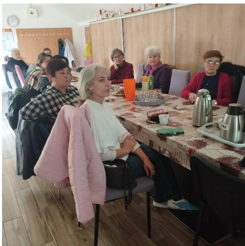
Radionica za roditelje, 11.12.2025.