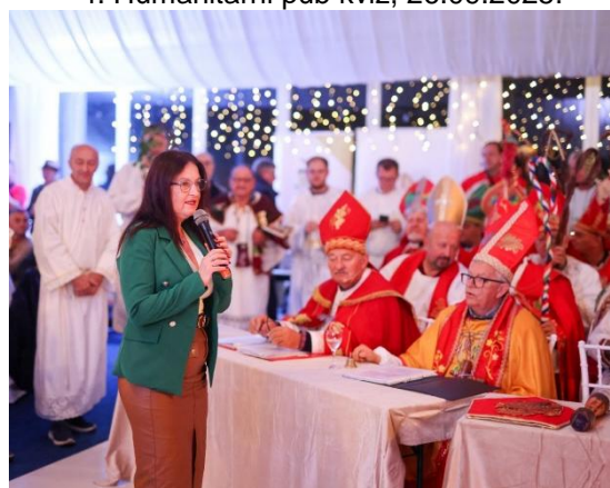
18. Velika martinjska špelancija