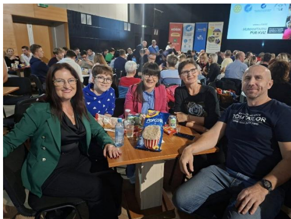
4. Humanitarni pub kviz, 26.09.2025.