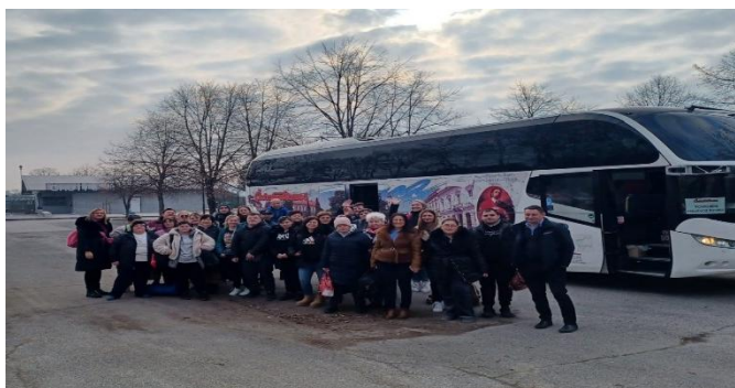
Putovanje u Terme Čatež, Slovenija, 07.02.2025.