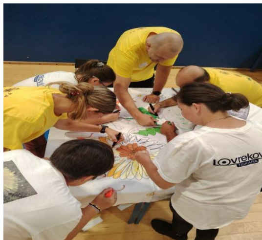
Olimpijski dan inkluzije u Varaždinu, 10.09.2025